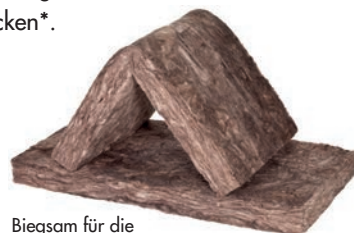
Biegsam für die Montage und dennoch fest im Gefach.

Handwerker stellen fest, dass sich die Dämmstoffe besonders angenehm verarbeiten lassen. 95 % bestätigen, dass Produkte mit ECOSE Technology weniger jucken*.