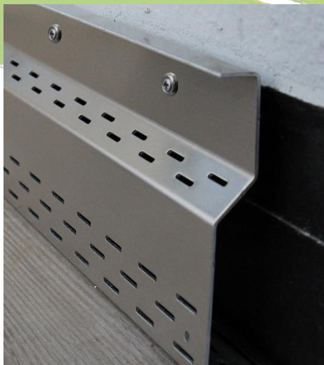
Abbildung 2: Anwendungsbsp. Alu Sockel-Wandprofil verschraubt mit Edelstahlschrauben