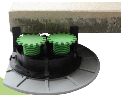
Abbildung 6: Das Schraub-Stelzlager ZR-V mit zwei gegenüberliegend entfernten Fugenstege und der VOLFI Bodenplatte gummiert 4/10 mit gekürzter Bodenplatte für die Randverlegung