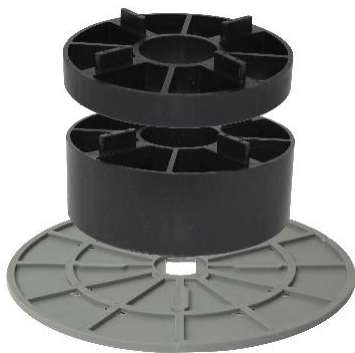
Abbildung 2: Beispielverlegung mit VT-U 20+50. Verwendet wird: VOLFI-Bodenplatte BP-GKU 0/00.