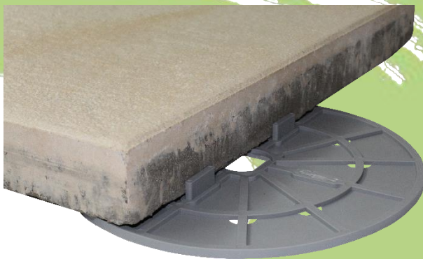
Abbildung 5: Die VOLFI Bodenplatte gummiert 4/10 mit zwei gegenüberliegend entfernten Fugenstege für die Randverlegung

Für gleichmäßige Fugen im Wandbereich wird der Wandabstandhalter WAE-K mit Klemmnase genutzt. Dieser wird einfach in die Fugenstege des I-Lagers eingelegt und verhindert ein „Kippen“ der Platten an der Wand.