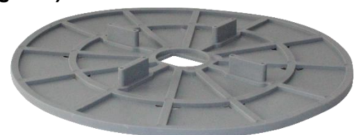
Abbildung 3: VOLFI-Bodenplatte BP-GKU 4/10.

Dies ist bei der Bodenplatte gummiert 4/10 z.B. bei Volfitellern ( VT-B/VT-U ), Kombitellern ( KT/KT-N ), VOLFI-Schraubstelzlager ( ZR-V ) und VOLFI Teleskop Dreh-Stelzlager ( TL-V ) oder bei der BP-GKU 0/00 für Volfiplatte ( VP-U ) bzw. Volfischeibe ( VS-U ) und der Drehstelzlager ( SK-V/RT-V ) möglich.