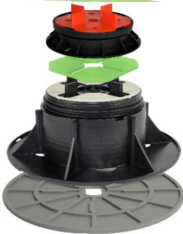
Abbildung 4: Die VOLFI Bodenplatte gummiert als unterstes Element zur 5mm Erhöhung oder als Entkoppelung. Hier mit opt. 8% Gefälleausgleich (KT-N).