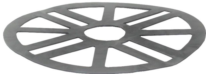
Abbildung 5: Ausgleichscheibe VT-A 1.0 oder 2.5mm. (Standardqualität)