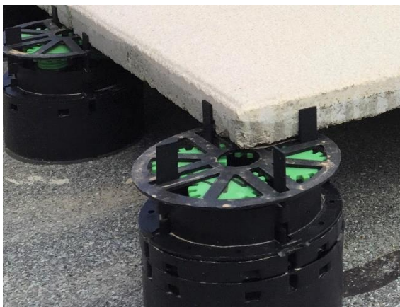
Abbildung 2: VT-U 50 + 2x VT-B 15 und Schraub-Stelzlager ZR-V mit aufliegender Ausgleichscheibe VT-A 1mm.