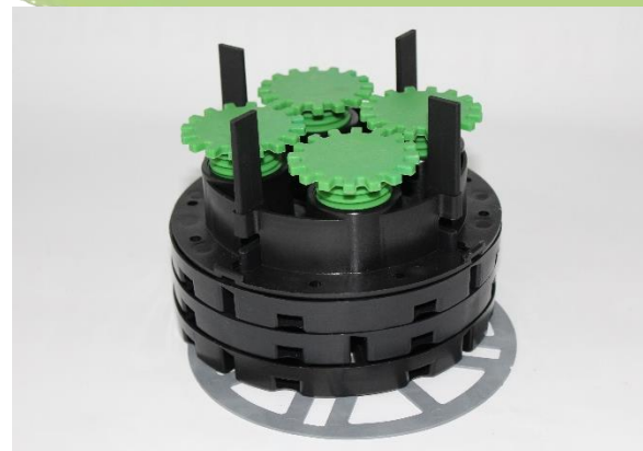
Abbildung 3: Drei Mal VT-B 15 mit aufgesetztem ZR-V und als Trittschalldämmung untergelegter VT-A 1mm. (Verstellbereich: 76-91mm) Achtung: VT-A vollflächig unterlegen!