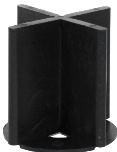
Abbildung 5: extra hohes Fugenkreuz mit Bodenplatte (52mm Fugenhöhe)

Ab einer Stückzahl von 40.000 Stück sind Sonderfarben nach RAL auf Anfrage lieferbar. Gegen geringen Aufschlag sind auch individuelle Verpackungseinheiten möglich. Aufgrund der vollautomatischen Verpackungsanlage wird innerhalb weniger Werktage geliefert. VOLFI Fugenkreuze werden in eigener Produktion in Deutschland gefertigt und stehen seit vielen Jahren für Qualität und Genauigkeit.