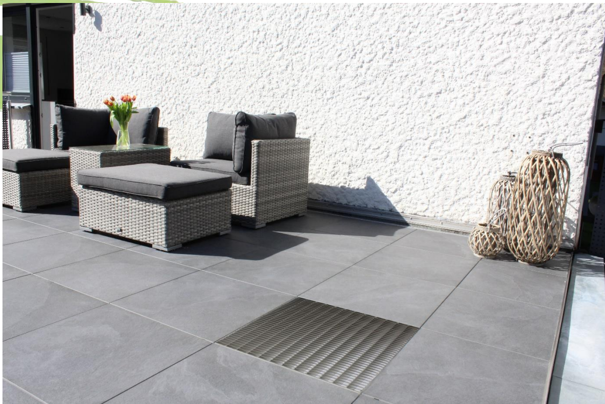
Abbildung 2: Anwendungsbeispiel Gitterrost GR-E